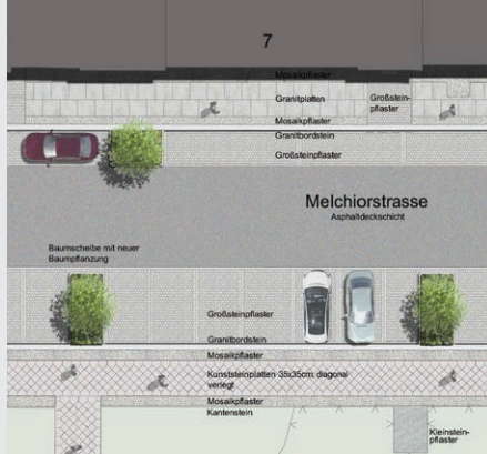
Ausschnitte aus der Straßenplanung

Abbildung links: Landschaftsarchitekturbüro gläser und dagenbach