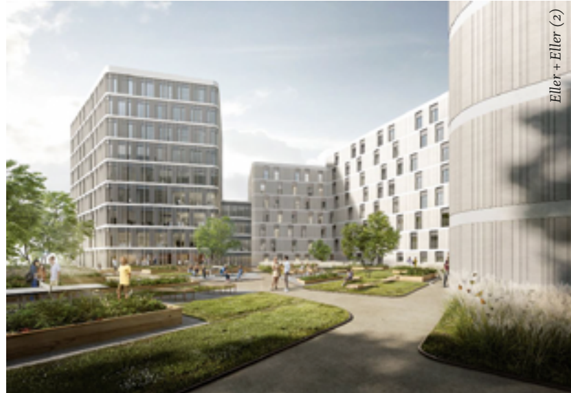
Eller + Eller (2)

Grundstück unmittelbar an der Stadtbahn in den Himmel ragen. Bauherren sind die landeseigene berlinovo Gewerbeimmobilien GmbH und die Berliner Bäderbetriebe. Die Architekten vom Düsseldorfer Büro Eller + Eller haben die Pläne längst ausgefertigt und auch ein Generalübernehmer ist bereits bestellt (PORR GmbH) und die Projektleitung beauftragt (Hitzler Ingenieure).