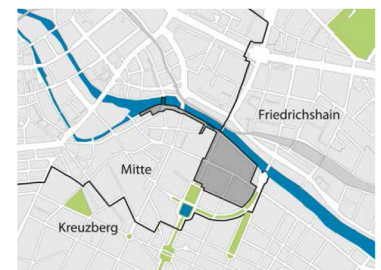
Sanierungsgebiet Nördliche Luisenstadt