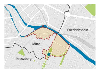
Fördergebiet Luisenstadt (Mitte) im Programm Städtebaulicher Denkmalschutz